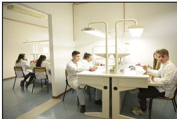
Indirizzo Odontotecnico / Il nostro Laboratorio