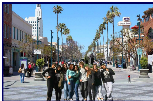
Indirizzo Grafico e della Comunicazione / I nostri ragazzi a Los Angeles (fotomontaggio a cura degli studenti del