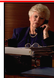
Indirizzo Socio Sanitario

Le innovazioni in atto nel settore richiedono allo studente conoscenze scientifiche e tecniche e competenze correlate alle scienze umane e sociali, alla cultura medico-sanitaria per comprendere il mutamento sociale, il nuovo concetto di salute e benessere, le dinamiche della società multiculturale e per riconoscere le problematiche relative alle diverse tipologie di utenza al fine di contribuire ad individuare e gestire azioni a sostegno di persone e comunità con particolare attenzione alle fasce deboli.