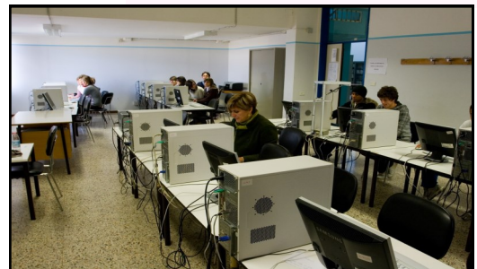
Indirizzo Commerciale Sportivo / Laboratorio Informatico e di Contabilità

Il corso e' articolato in cinque anni con Qualifica al terzo anno e stage aziendali dal secondo al quinto anno.