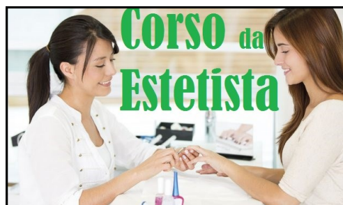
Indirizzo Operatore del Benessere Estetista

Ed, infine, operare in proprio aprendo una propria attività.