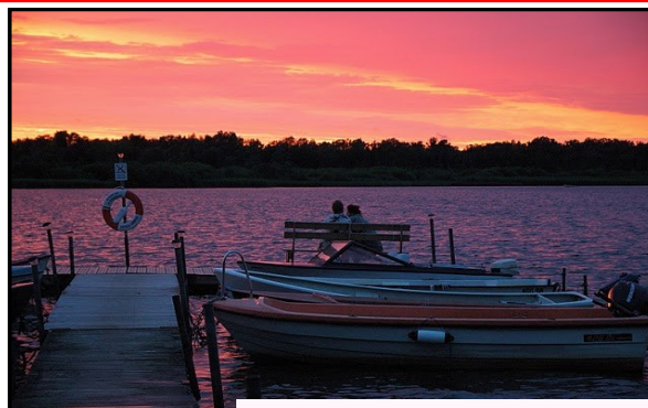
Indirizzo Grafico e della Comunicazione Fotografica

Il diplomato in questo indirizzo è in grado di intervenire in aree tecnologicamente avanzate dell'industria grafica, fotografica e multimediale, della cinematografia, utilizzando metodi progettuali, materiali e supporti diversi in rapporto ai contesti e alle finalità comunicative richieste.